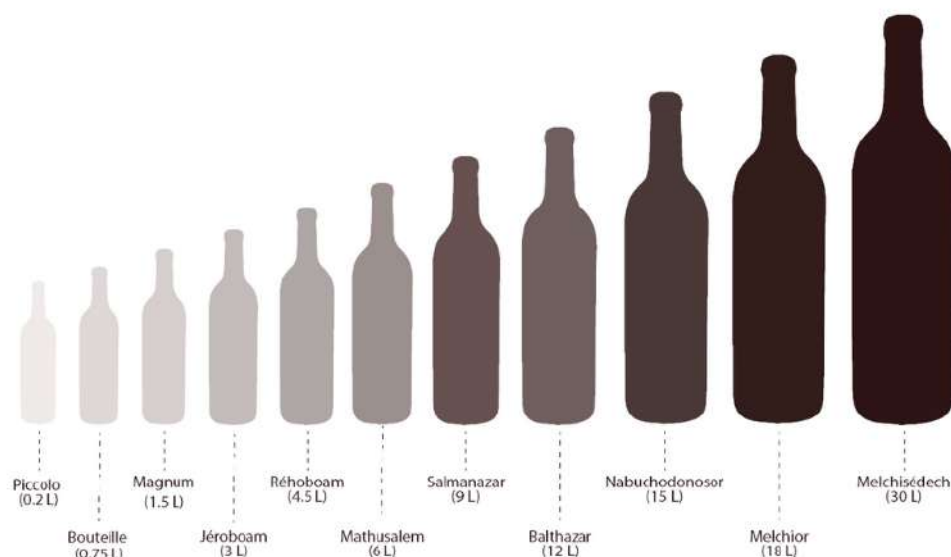
Les noms et tailles des différentes bouteilles de vin